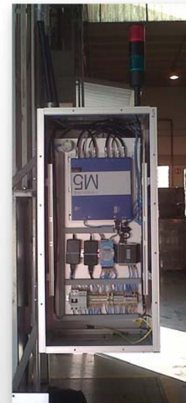
Solução RFID que Garante Rastreabilidade